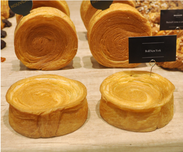
Roll New York, disque de pâte à croissants pour préparation salée ou sucrée chez Europastry