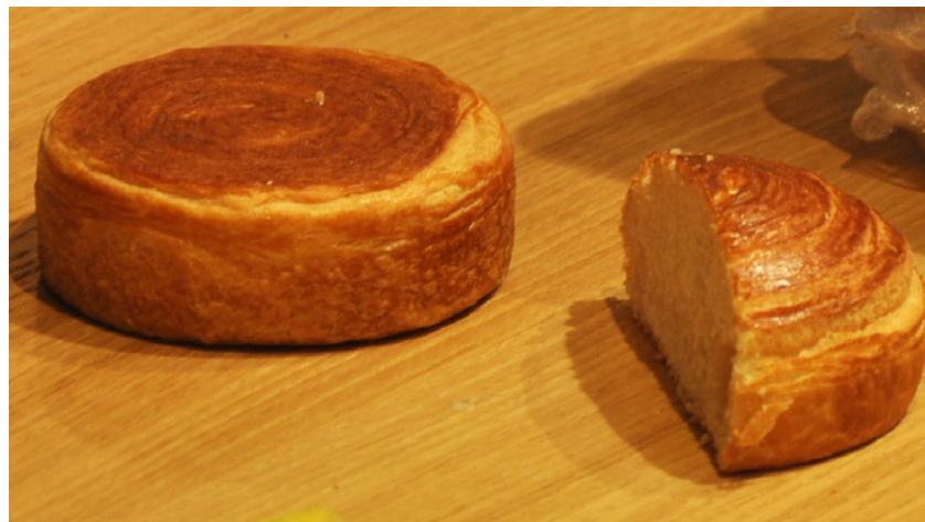
Bun'roll, buns en pâte à croissant chez Bridor