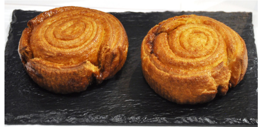
Roll' caramel au beurre d'Isigny Ste Mère chez coup de pates