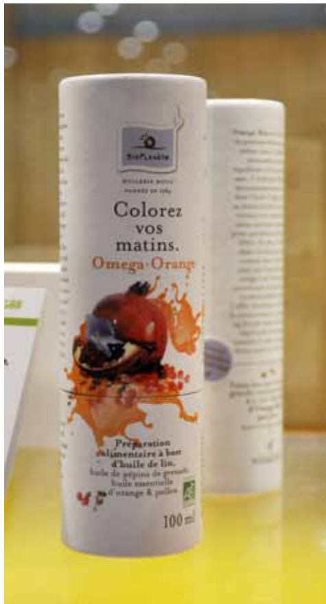
Bio Planète – Omega Color Préparations alimentaires à base d'huile de lin