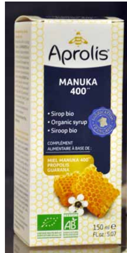
Europ Labo – Aprolis Le miel de Manuka (encore lui) allié à la Propolis pour une action anti bactérienne et soulager les gorges irritées.