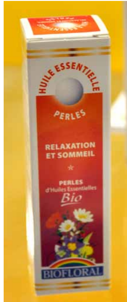
Biofloral Des huiles essentielles bio à croquer. Pour un dosage précis et une prise plus sécuritaire. 1 goutte = 6 perles