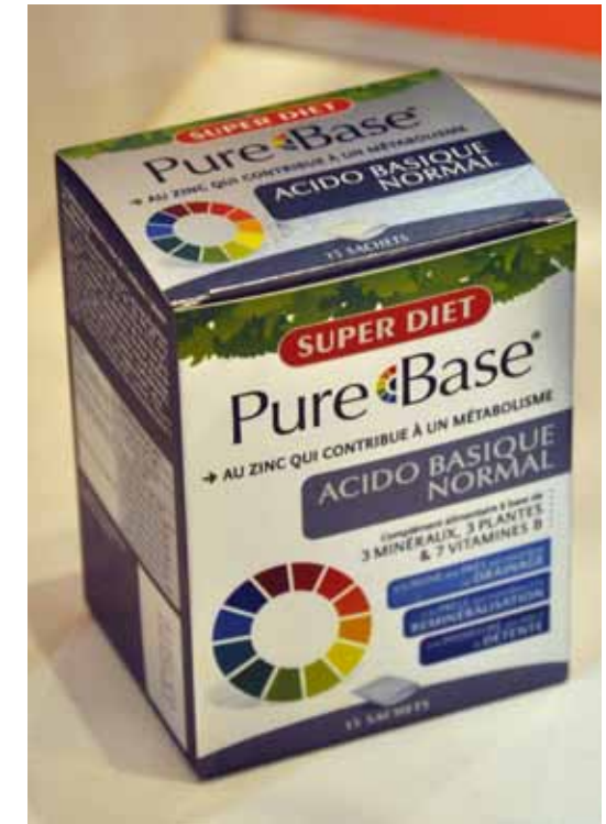
Super Diet – Pure Base Complexe de 3 minéraux, 3 plantes et 7 vitamines dont le zinc qui contribue à un métabolisme Acido- basique normal.